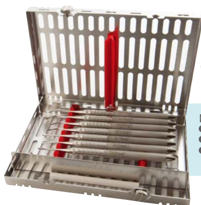
⑧ キット EPTKIT ¥72,000