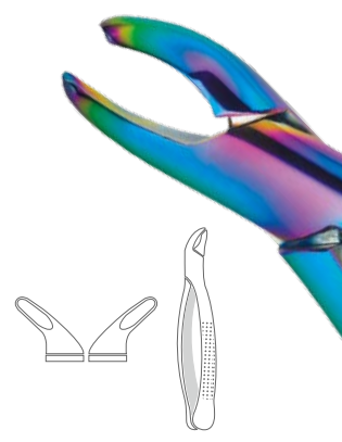
抜歯鉗子 プレジデンシャル 小児用 151S レインボー