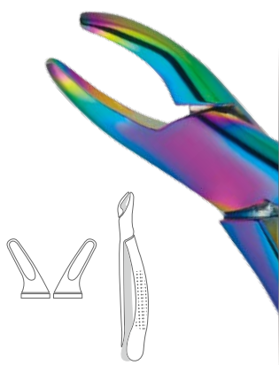
抜歯鉗子 プレジデンシャル 小児用 150S レインボー

ヒューフレディ社の抜歯鉗子 プレジデンシャル 小児用 レインボーはユニークなレインボー色のコーティングを施し、幼児の歯牙形態に適したデザインなので、お子様の不安を軽減しつつ低侵襲な状態で抜歯をすることが可能になります。