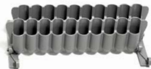
シリンジスタンド 20本用