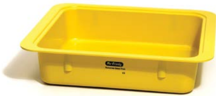
シグネチャータブ

※タブやタブセットのパーツは、製造工程で抗菌加工されています。 この加工により、微生物の影響や増殖・拡散に関わる重要な細胞機能を阻害します。抗菌作用は、微生物が製品の表面に接触すると直ちに作用を開始し、シミや臭い、製品の腐蝕を惹起する微生物の成長を抑制します。この作用は製品の耐用期間を通して続きます。