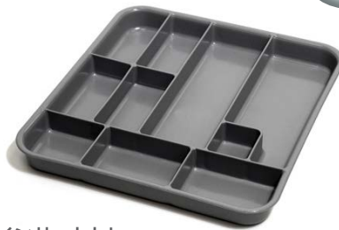
インサートトレイ