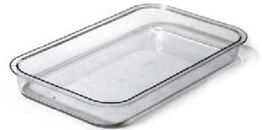
スライドトレイ 仕切無 †

タブ内を整理しやすいように10区画に仕切られたインサートトレイ。タブのフチにトレイが乗る構造で、下部にも保管スペースを確保。