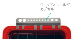
クリップオンホルダー カプセル

フタ付ケースに・ブラシ・ラバーダムクランプ、綿球、シリンジチップ、予防用研磨ペースト、予防用ハンドピース、歯科用研磨剤、インプラント器材などを収納できます。