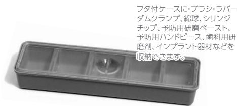
フタ付ケース L †