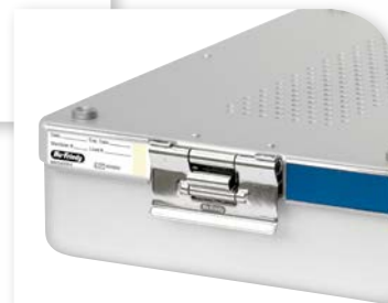
インジケーターカード