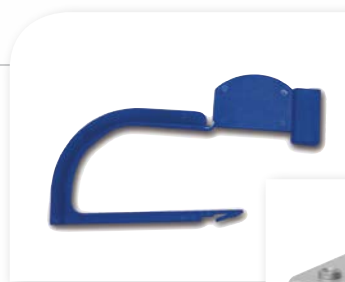
ラッチ開封防止シール