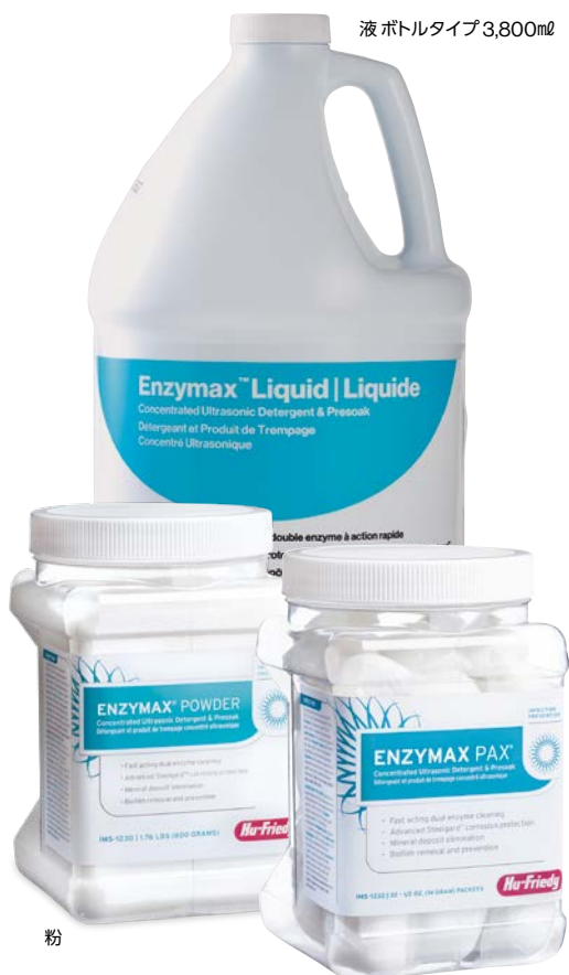
液 ボトルタイプ 3,800ml

Infection Prevention and Instrument Management