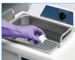
粉 個別包装タイプ