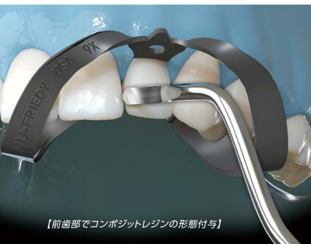
【前歯部でコンポジットレジンの形態付与】