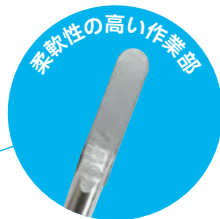
柔軟性の高い作業部