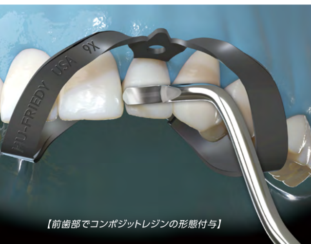
【前歯部でコンポジットレジンの形態付与】