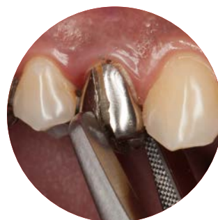
セメントが壊れ少し浮き上がったら 仮歯用鉗子 (CRGR) で 除去する