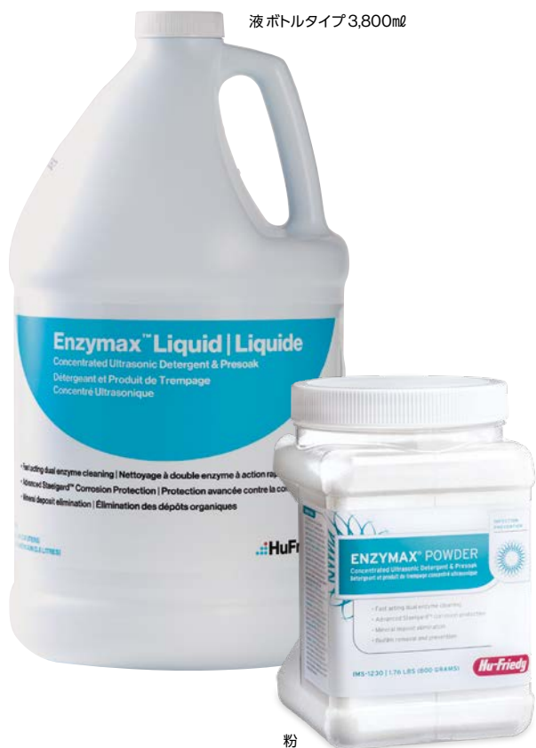
液 ボトルタイプ 3,800ml

Infection Prevention and Instrument Management